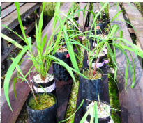
Testando tolerância de novos acessos de brizanta

MAPEAMENTO – O diagnóstico do problema, contudo, nem sempre é fácil, exigindo avaliação in loco, por técnico habilitado. "Existem encharcamentos naturais, provocados por chuvas intensas, encharcamentos sazonais dos rios ou afloramento do lençol freático, mas esse problema também